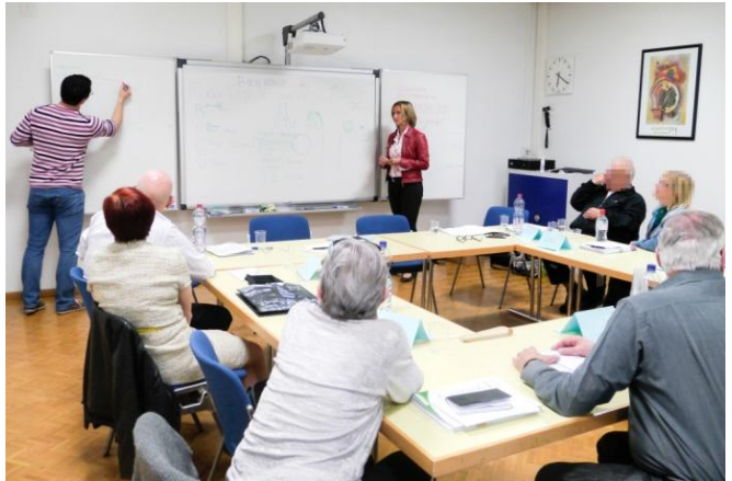
Les ateliers « Mieux vivre avec une BPCO »