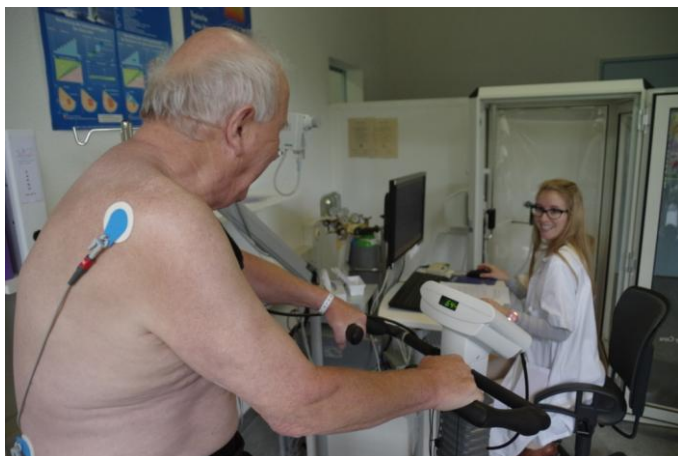
Un bilan est effectué avant de débiter le programme

Vous devez être adressé par un médecin. Le Service de pneumologie ou de physiothérapie peut vous renseigner.