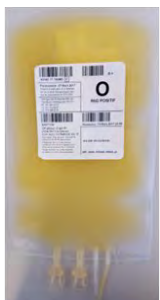
Fig.1 : inaktives Thrombozytenkonzentrat

Thrombozyten können von einem einzigen Spender (Apherese-Thrombozyten) oder von mehreren Spendern gewonnen werden, welche dieselbe Blutgruppe ABO aufweisen (Thrombozyten aus Vollblut). Die Thrombozytenkonzentrate (TK) (Abb. 1) sind filtriert, damit der grösste Teil der Leukozyten eliminiert ist (geringeres Risiko der Übertragung von Infektionserregern, der Transfusionsreaktionen und der Alloimmunisierung HLA). Um die Lebensfähigkeit der Thrombozyten zu erhalten, werden diese in einer additiven Nährlösung (zur Reduktion der verbleibenden Menge an Plasma), bei kontrollierter Raumtemperatur ( 22 \pm 2^\circ\text{C} ), unter konstanter Agitation und höchstens während 7 Tagen gelagert. Seit 2011 wird für die TK in der Schweiz ein Verfahren zur Reduktion der Krankheitserreger angewendet (Amotosalen + UVA), mit dem die meisten